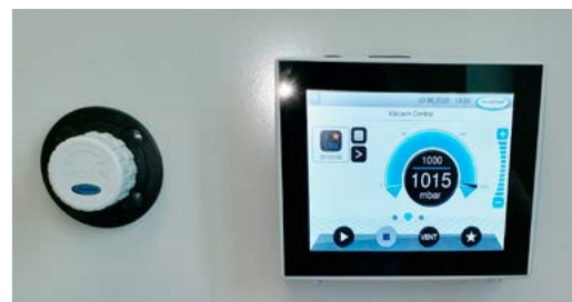
Tüüp II Teenindusmooduliga laborilaud